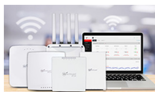
Sicheres, cloud-verwaltetes WLAN